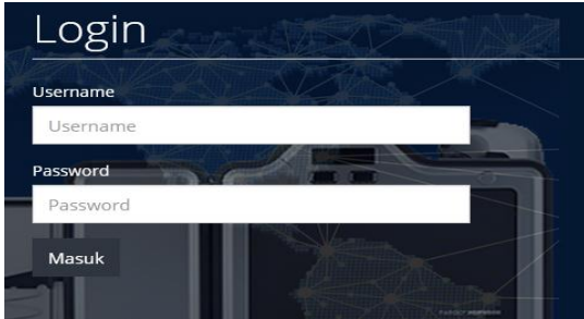
Gambar 2 Menu Login