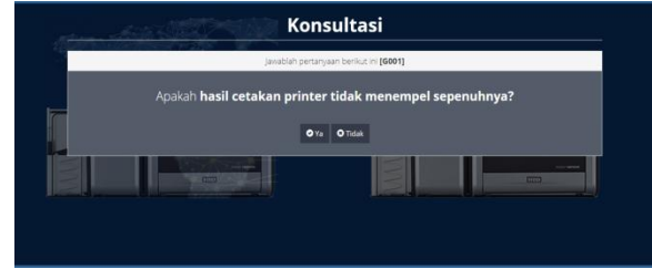
Gambar 6. Tampilan pertanyaan Diagnosa