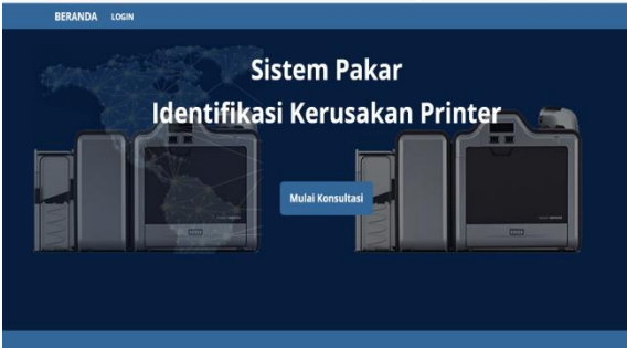
Gambar 3. Tampilan Beranda