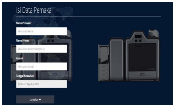
Gambar 5. Tampilan Data Pemakai