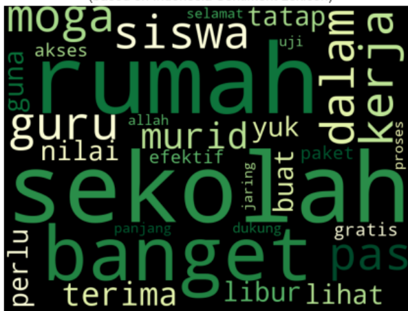
Gambar 3. WordCloud Sentimen Positif Word Cloud of Negative Words on Tweets Data (based on Indonesia Sentiment Lexicon)