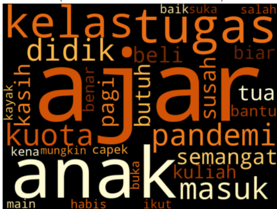
Gambar 4. WordCloud Sentimen Negatif

Berdasarkan gambar 3, dapat dilihat bahwa 5 (lima) kata yang paling sering muncul dalam kalimat opini positif pembelajaran daring adalah : 1) "sekolah", 2) "rumah", 3) "guru", 4) "siswa", dan 5) "nilai". Kata "sekolah" terkait dengan metode pembelajaran daring, yaitu rumah sebagai sekolah. Selain itu, kata "sekolah" memiliki hubungan dengan kata "rumah". Sebagai contoh "metode belajar mandiri secara daring dari rumah yang menyenangkan". Kata "sekolah" juga merepresentasikan