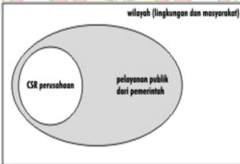
Gambar 3. Sinergi CSR dengan Pelayanan Publik dari Pemerintah

Di luar itu pemerintah daerah juga menerbitkan aneka produk sejenis Perda CSR. Setidaknya lebih dari 50 Kabupaten/Kota di Indonesia telah Menerbitkan Perda CSR. Sebagian daerah mampu mengimplementasikan Perda, dan hanya sebagian kecil daerah mendapatkan impact dari keberadaan Perda CSR seperti tampak dalam gambar berikut :