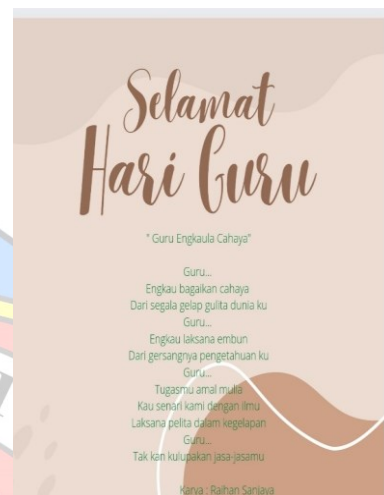
Gambar2.Puisi sesudah menggunakan Canva