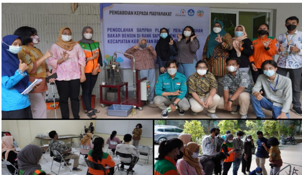
Gambar 4. Pelatihan teknis penggunaan reaktor pirolisis kepada pengelola Bank Sampah Seni Baru

Pengelola Bank Sampah Seni Baru tampak antusias selama pelaksanaan pelatihan teknis pirolisis tersebut seperti yang tampak dalam dokumentasi kegiatan selama pelaksanaan teknis dalam Gambar 4. Dari umpan balik singkat yang dituliskan oleh pengelola peserta pelatihan teknis, rata-rata memberikan tanggapan positif yaitu kegiatan pelatihan reaktor pirolisis sudah berlangsung dengan baik dan dapat menambah wawasan pengelola Bank Sampah Seni Baru. Peserta juga memberikan masukan berupa peningkatan kapasitas reaktor pirolisis serta memperkenalkan teknologi pirolisis kepada warga sekitar Bank Sampah Seni Baru.