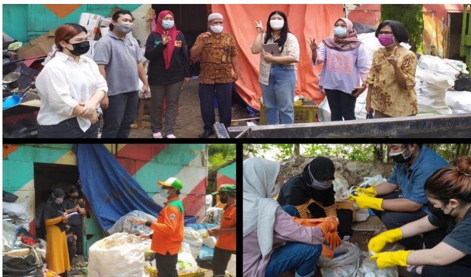
Gambar 3. Kunjungan, wawancara dan pemilahan sampah di Bank Sampah Seni Baru

Pada tahapan pertama, tim pelaksana melakukan wawancara singkat untuk mengumpulkan informasi mengenai aktivitas yang berlangsung di Bank Sampah Seni Baru. Selanjutnya, kegiatan ini dimulai dengan peninjauan jenis sampah plastik yang tersedia di Bank Sampah Seni Baru. Terdapat beberapa jenis sampah plastik di Bank Sampah Seni Baru, diantaranya yaitu jenis polietilen dan polipropilen . Operasionalnya Bank Sampah melakukan pemilahan sampah plastik secara manual. Tim pelaksana kegiatan berkesempatan melakukan pemilahan sampah plastik di Bank Sampah Seni Baru, yang nantinya akan digunakan dalam pirolisis. Sampah plastik yang digunakan adalah plastik penutup galon air mineral. Penutup air galon mineral merupakan jenis plastik High Density Polyethylene (HDPE). Sampah plastik tersebut dicuci bersih dan dikecilkan ukurannya menjadi \pm 1 \text{ cm} \times 2 \text{ cm} . Dokumentasi kegiatan ditunjukkan dalam Gambar 3.