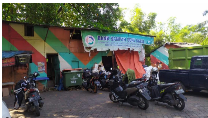
Gambar 1. Bank Sampah Seni Baru

Kehadiran bank sampah menarik animo masyarakat sekitarnya. Hal ini tampak dari pertambahan jumlah bank sampah. Pada mulanya, bank sampah yang berlokasi di area Jakarta Selatan hanya berjumlah 611 titik pada bulan Maret 2020, akan tetapi pada bulan Juli 2020, berdiri bank sampah hingga 637 titik. Kenaikan ini bertambah antara satu hingga tiga titik dalam satu kecamatan (Amna, 2020). Bank Sampah Seni Baru merupakan salah satu titik dari 61 titik bank sampah dalam lingkup Jakarta Selatan, tepatnya di Jl. Kramat Pela, RT.5/RW.4, Kecamatan Kebayoran Baru, Kota Jakarta Selatan, Daerah Khusus Ibukota Jakarta 12130 (Gambar 1).