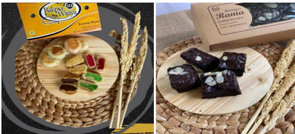
Gambar 2. Hasil foto produk

Dalam rangka meningkatkan kualitas konten promosi pada Instagram UMKM Klepu Lor berupa foto dan video dilakukan pelatihan dan pendampingan pembuatan foto produk. Teknis pelaksanaan pelatihan dan pendampingan foto produk dilakukan dengan mendatangi masing-masing UMKM ke lokasi usahanya. Mereka dilatih bagaimana mengambil gambar dengan peralatan handphone tapi hasilnya berkualitas. Pemilihan tempat, teknik pencahayaan, background , pemilihan "angle", dan beberapa teknis fotografi lainnya disampaikan tim. Tim terlebih dahulu mendemonstrasikan langkah-langkah pembuatan foto, kemudian masing-masing UMKM diminta untuk mencoba. Hasil percobaan UMKM dievaluasi dan jika kualitas foto belum bagus dan menarik maka tim memberikan masukan dan meminta UMKM tersebut untuk mencoba lagi sampai didapatkan hasil yang berkualitas. Hasil pelatihan foto produk dapat dilihat di gambar 2. Pelatihan berikutnya adalah tim mendemonstrasikan bagaimana cara mengunggah foto tersebut di Instagram, cara membuat caption yang menarik, waktu yang tepat untuk mengunggah, termasuk juga pentingnya menulis hashtag pada setiap unggahan. Kemudian UMKM melakukan praktek mengunggah konten di Instagram. Hasil foto produk yang diunggah di Instagram kelompok UMKM Klepu Lor bisa dilihat pada gambar 3.