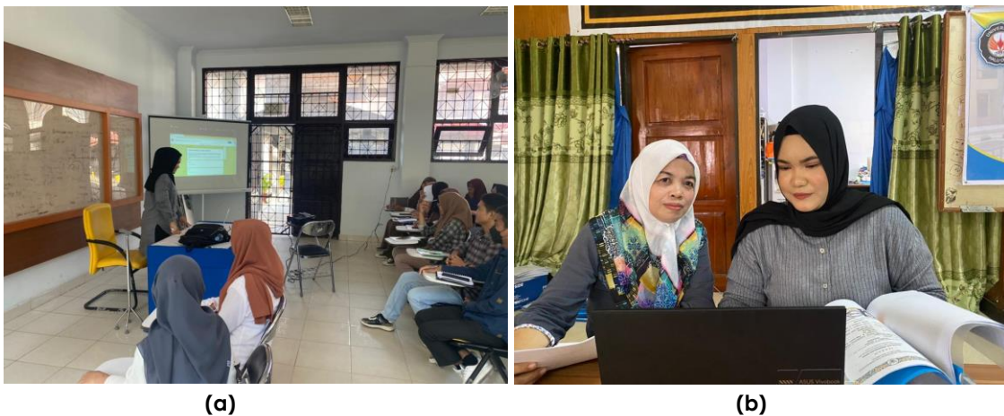
(a) (b) Gambar 5. Presentasi dan pemanduan dalam pelatihan Google Form (a) Pendampingan Staff Administrasi dalam pelatihan Google Form (b)

Setelah diperlihatkan tampilan Google Forms dan memandu cara pengisiannya, selanjutnya masuk pada kegiatan pelatihan pengisian untuk peserta, seperti terlihat pada gambar berikut: