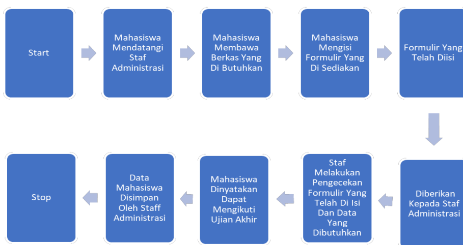
Gambar 1. Alur Pendaftaran Manual Mahasiswa

Kemajuan teknologi informasi saat ini sangat berpengaruh dan bermanfaat di berbagai bidang. Di Indonesia, berbagai bidang telah mengalami transformasi yang signifikan, termasuk bidang pendidikan. Transformasi ini menimbulkan banyak masalah pada masyarakat kita yang belum sepenuhnya menguasai teknologi (Davies & West, 2014). Teknologi yang biasanya hanya digunakan untuk komunikasi dan hiburan, kini harus ditingkatkan fungsinya sebagai media pendidikan (Yusron et al., 2020). Menurut Astini (2020), pemanfaatan teknologi informasi merupakan salah satu upaya dalam perbaikan manajemen baik pada sekolah dan universitas. Hal ini telah dibuktikan pula bahwa teknologi dapat membantu dalam melaksanakan proses belajar mengajar, akan tetapi, dalam hal memfasilitasi penggunaan teknologi ini, ada kalanya staf administrasi dan mahasiswa merasa perlu memperoleh tambahan pengetahuan dalam teknologi yang diperlukan untuk menghadapi kendala yang terjadi. Sasaran peserta dalam pengabdian ini merupakan staf administrasi dan mahasiswa pada Program Studi Manajemen, Fakultas Ekonomi dan Bisnis, Universitas Halu Oleo, Kendari.