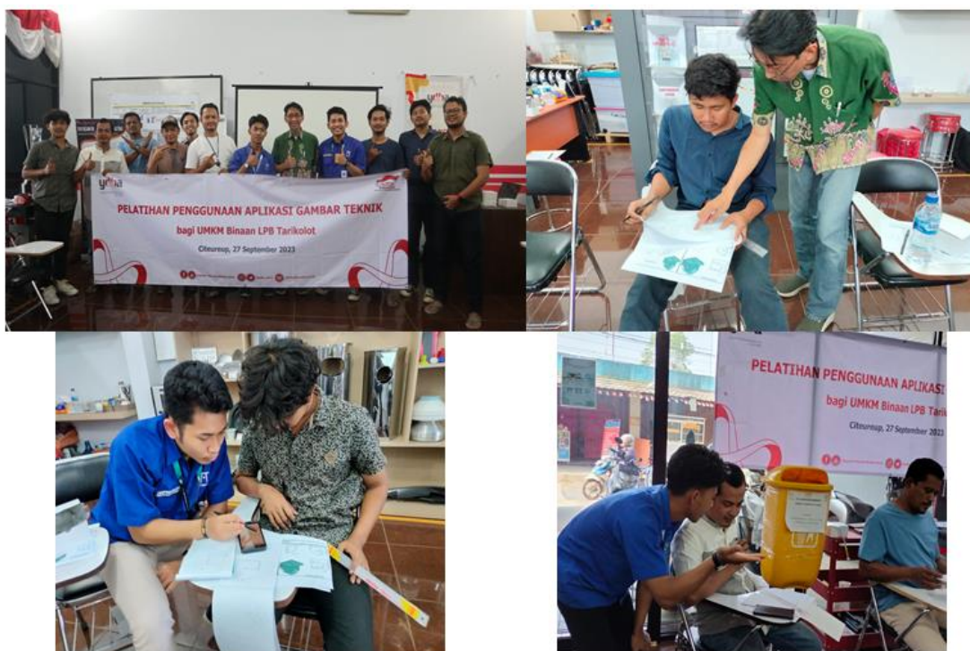
Gambar 1. Pelaksanaan pelatihan penggunaan aplikasi gambar teknik

Pelatihan dihadiri 8 peserta yang berasal dari 6 UMKM Binaan LPB Tarikolot yang terdiri dari Dewoz Art, UD Ibnu Pratama, Adiwijaya Teknik, UD Karunia Mandiri, Candra Putra Mandiri dan Haristeknik. Berikut adalah bukti pelaksanaan pelatihan penggunaan aplikasi gambar teknik dapat dilihat pada Gambar 1.