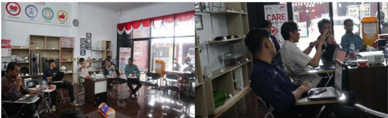
Gambar 3. Pelaksanaan pendampingan ke-1

Setelah dilaksanakan pelatihan pada tanggal 27 September 2024, selanjutnya akan dilaksanakan 3 kali pendampingan. Harapannya saat pendampingan, peserta sudah memiliki aplikasi gambar teknik. Pendampingan pertama dilaksanakan di Kantor LPB-YDBA Tarikolot, Citeureup, Bogor yang dihadiri 4 peserta pelatihan dari UMKM UD Ibnu Pratama, UD Karunia Mandiri, Haristeknik dan Dewoz Art. Dari keempat UMKM yang mengikuti pendampingan pertama, UD Ibnu Pratama dan UD Karunia Mandiri diketahui belum memiliki aplikasi gambar teknik sehingga ada kendala di proses pengembangan softskill peserta. Berikut adalah bukti pelaksanaan pendampingan pertama penggunaan aplikasi gambar teknik dapat dilihat pada Gambar 3.