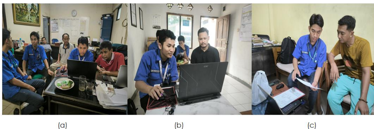
Gambar 5. Pelaksanaan pendampingan ke-3 UD Adiwijaya Teknik (a); UD Dewoz Art (b); UD Ibnu Pratama (c)

Pendampingan ketiga dilaksanakan di UMKM UD Dewoz Art, UD Ibnu Pratama dan CV Adiwijaya Teknik. Ketiga UMKM sudah memiliki aplikasi gambar teknik sehingga pendampingan dilakukan untuk pendalaman penggunaan software gambar teknik yang sudah mereka miliki. Berikut adalah bukti pelaksanaan pendampingan ketiga penggunaan aplikasi gambar teknik dapat dilihat pada Gambar 5.