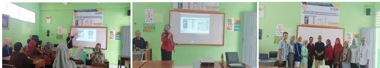
Gambar 3. Proses kegiatan bimbingan teknis canva, Interaksi tim pelaksana dan peserta bimbingan teknis Canva, dan Sesi foto bersama dengan peserta bimbingan teknis Canva