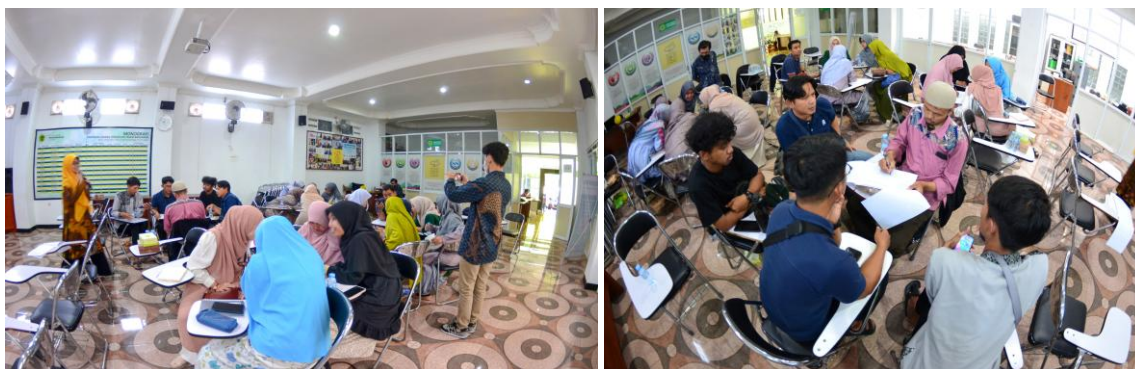
Gambar 4. Kegiatan Pendampingan dan Pelatihan-Bagian 2

Kegiatan pada gambar 3 adalah pemaparan materi mengenai pengantar akuntansi. Sedangkan kegiatan pada gambar 4 merupakan praktek penyusunan laporan keuangan. Pada kegiatan penyusunan laporan keuangan, para peserta diberikan contoh dan dibagi kedalam kelompok-kelompok untuk berdiskusi secara langsung mengenai penyusunan laporan keuangan. Tahapan pelatihan penyusunan laporan keuangan: