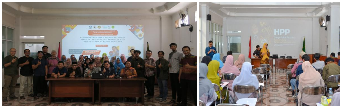
Gambar 3. Kegiatan Pendampingan dan Pelatihan- Bagian 1