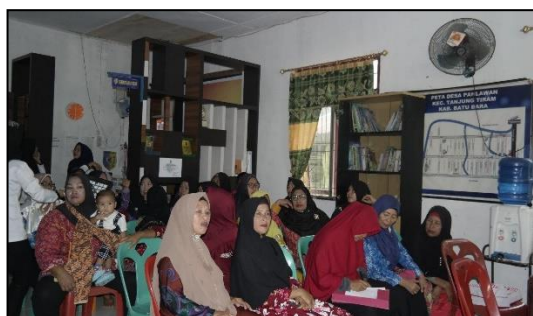
Gambar 5. Wanita Nelayan sebagai Peserta Edukasi

pernikahan, jumlah anggota keluarga, kepemilikan modal, pendapatan rumah tangga per bulan pengeluaran rumah tangga per bulan, kondisi rumah, dan akses kesehatan (Rangkuty, 2018b).