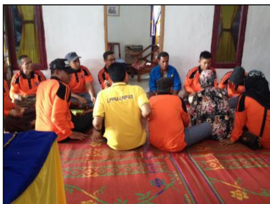
Gambar 7. Diskusi Kelompok Nelayan