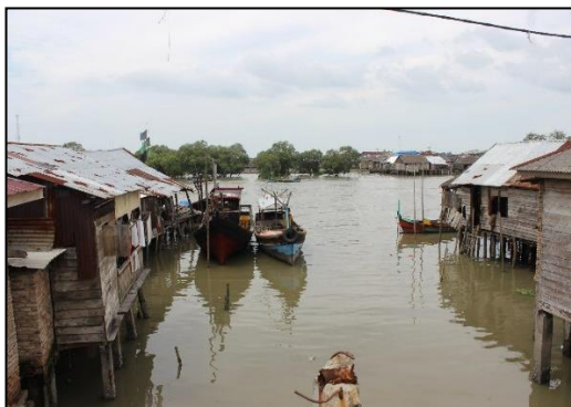
Gambar 1. Observasi Pemukiman Nelayan di Desa Pahlawan