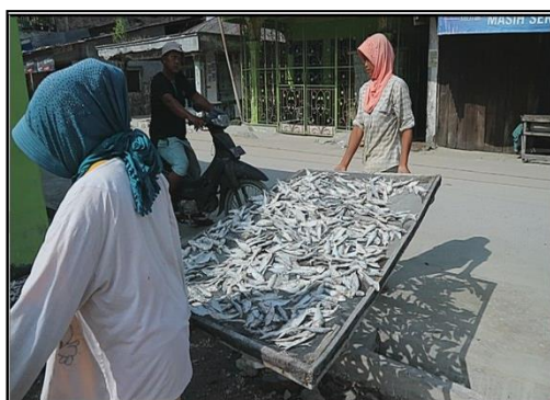
Gambar 7. Wanita Nelayan Saat Sortir Hasil Tangkap

Sesuai dengan jadwal, metode dan rencana pelaksanaan program yang sudah ditentukan adapun hasil yang diperoleh dalam kegiatan ini adalah kelompok nelayan dan wanita nelayan antusias dalam mengajukan pertanyaan di forum diskusi setelah tahapan ceramah edukasi oleh tim. Anggota kelompok nelayan menyampaikan keluhan tentang pendistribusian bantuan alat tangkap yang tidak merata sehingga hal demikian yang menjadi kendala peningkatan produktivitas. Hal ini yang juga terjadi di Kabupaten Sambas (Alfian; Martoyo; Listiani, 2014). Selain itu, anggota kelompok nelayan telah mendapat fasilitas kartu identitas nelayan dan kartu asuransi nelayan sebagai bentuk program pemerintah KKP. Bagi wanita nelayan, atau disebut juga ibu rumah tangga nelayan juga antusias mengajukan pertanyaan dalam forum sebagai bentuk semangat mitra nelayan dalam meningkatkan produktivitas tentang pemanfaatan jumlah produksi/hasil tangkap menjadi nilai tambah seperti menjemur hasil tangkap yang dijual kering di pasar kepada masyarakat. Ini terlihat sesuai pada Gambar di bawah ini.