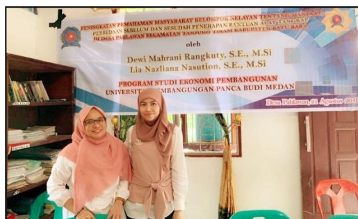
Gambar 6. Kami sebagai Tim Pelaksana Pengabdian di Desa Pahlawan

Jumlah responden yang menjadi objek pengabdian adalah 100 orang dari 12 Dusun di Desa Pahlawan, yang terdiri dari 8 orang di Dusun Sejarah, 7 orang di Dusun Bandar, 6 orang di Dusun Lobai Abbas, 9 orang di Dusun Wan Ahmad, 9 orang di Dusun Amanah, 9 orang di Dusun Sejahtera, 9 orang di Dusun Nelayan, 9 orang di Dusun Nilam, 9 orang di Dusun Pabrik, 9 orang di Dusun Bogak, 9 orang di Dusun Bunga Jumpa, 7 orang di Dusun Adi Daya.