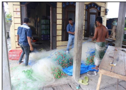
Gambar 2. Bantuan Alat Tangkap Jaring Angkat Kelompok Nelayan

Jenis hasil tangkapan nelayan Desa Pahlawan diantaranya berupa banyak jenis ikan laut, ikan teri, cumi-cumi, udang, kepiting, kerang. Salah satu distribusi bantuan alat tangkap jaring angkat yang terasa manfaatnya oleh kelompok nelayan pada Gambar 2. Tingkat produktivitas nelayan pesisir dapat dilihat dari berapa banyak jumlah produksi/hasil tangkap pada sekali melaut, jam kerja per hari dan harga jual yang berlaku di TPI dan atau pasar (Rangkuty, 2018b). Jam kerja 100 orang nelayan pesisir di Desa Pahlawan memiliki jam kerja rersingkat adalah 8 jam per hari pada sebelum dan sesudah penerapan bantuan alat tangkap. Dan dengan adanya penerapan bantuan alat tangkap, jam kerja terlama per hari 100 orang nelayan pesisir di Desa Pahlawan menjadi berkurang, yakni 14 jam per hari sebelum penerapan bantuan menjadi 11 jam per hari sesudah penerapan bantuan. Adanya efisiensi waktu jam kerja melaut pada nelayan. Harga jual hasil tangkap 100 orang nelayan pesisir di Desa Pahlawan memiliki harga jual paling rendah adalah Rp 27.000,- per kilogram per hari pada sebelum penerapan bantuan alat tangkap dan Rp 28.000,- per kilogram per hari pada sesudah penenapan bantuan alat tangkap. Harga jual paling tinggi pada saat sebelum penerapan bantuan alat tangkap adalah Rp 33.000,- dan Rp 32.000,- pada saat sesudah penerapan bantuan alat tangkap. Tidak menunjukkan perubahan angka harga jual yang cukup signifikan.