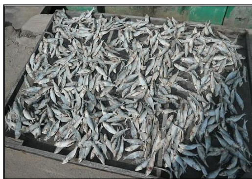
Gambar 8. Salah Satu Hasil Tangkap Nelayan

Tahap akhir dari kegiatan pengabdian ini adalah monitoring dan evaluasi yang akan dilakukan pada tahun 2020. Hasil monitoring adalah masyarakat kelompok nelayan masih terus berupaya meningkatkan produktivitas mereka dengan terus melaut menggunakan bantuan alat tangkap dari pemerintah. Menjaga, memelihara dan merawat bantuan alat tangkap agar nilai guna terus dapat dirasakan. Kelompok nelayan bekerja sesuai jam kerja dan harga jual hasil tangkap di TPI masih stabil. Wanita nelayan terus turut membantu nelayan dalam menyortir hasil tangkap melaut juga ikut berpartisipasi dalam menciptakan produk-produk tambahan hasil melaut yang dikeringkan agar dapat dijual di lingkungan pemukiman hingga pasar setempat. Dan tahap evaluasi nanti adalah tim harus mendata dan mencari informasi terkait besaran jumlah produksi/hasil tangkap, juga pendapatan rumah tangga nelayan sebelum dan sesudah kegiatan edukasi ini berjalan. Sehingga hal ini yang menjadi indikator nilai guna kebermanfaatan keberhasilan program kegiatan pengabdian ini dan atau pemerintah KKP melalui Dinas setempat. Penerapan bantuan alat tangkap oleh pemerintah akan memberi