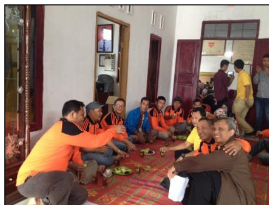
Gambar 8. Anggota Kelompok Nelayan

Sesuai dengan jadwal, metode dan rencana pelaksanaan program yang sudah ditentukan adapun hasil yang diperoleh dalam kegiatan ini adalah kelompok nelayan dan wanita nelayan antusias dalam mengajukan pertanyaan di forum diskusi setelah tahapan ceramah edukasi oleh tim. Anggota kelompok nelayan menyampaikan keluhan tentang pendistribusian bantuan alat tangkap yang tidak merata sehingga hal demikian yang menjadi kendala peningkatan produktivitas. Hal ini yang juga terjadi di Kabupaten Sambas (Alfian; Martoyo; Listiani, 2014). Selain itu, anggota kelompok nelayan telah mendapat fasilitas kartu identitas nelayan dan kartu asuransi nelayan sebagai bentuk program pemerintah KKP. Bagi wanita nelayan, atau disebut juga ibu rumah tangga nelayan juga antusias mengajukan pertanyaan dalam forum sebagai bentuk semangat mitra nelayan dalam meningkatkan produktivitas tentang pemanfaatan jumlah produksi/hasil tangkap menjadi nilai tambah seperti menjemur hasil tangkap yang dijual kering di pasar kepada masyarakat. Ini terlihat sesuai pada Gambar di bawah ini.